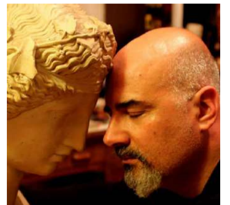
Rubrica a cura del dott. Alessandro Spampinato Psicologo e psicoterapeuta

cosa della realtà oppure ci costruiamo sistemi interpretativi, più o meno razionali, per illuderci di sapere qualcosa e tirare a campare. Di certo dovremmo tutti diffidare di chi ci vende verità o percorsi salvifici e imparare, essendo adulti e per quanto possibile, a esplorare e conoscere il mondo in prima persona, sapendo che possiamo solo farci un'idea soggettiva di ciò che siamo e ci accade e provare ad essere felici in questo meraviglioso viaggio che è la vita, in questo incredibile mistero dell'universo di cui facciamo parte.